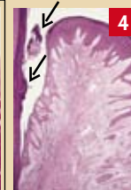
Fig. 4 : exemple de tartre sous-gingival (flèches)