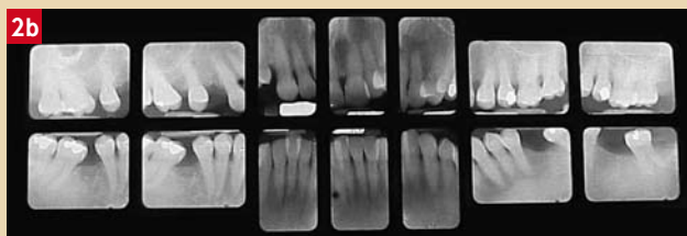
Fig. 2a et 2b : cas clinique où la présence de tartre est compatible avec le maintien du niveau de l'attache ; cette patiente de 55 ans ne souffre que d'une banale gingivite chronique stable malgré une absence quasi totale de visite chez le dentiste pendant des dizaines d'années