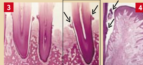
Fig. 3 : localisation du tartre supra-gingival (flèches)