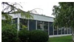
■ Charles Foix à Ivry/Seine UFR d'Odontologie Paris Descartes

Les 3 centres institutionnels qui participent à l'essai clinique