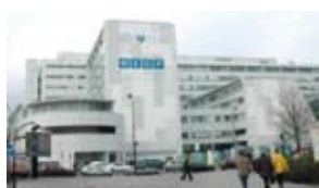
■ Unité de Recherche Clinique de l'Hôpital Européen Georges Pompidou

Depuis quelques années, la CFAO directe pénètre progressivement le milieu professionnel en France, les cabinets dentaires et commence à être enseignée dans le cursus initial dans la majorité des facultés de l'hexagone. Elle fait actuellement l'objet d'un innovant protocole de recherche clinique multicentrique entre les facultés de Montrouge, de Toulouse et les experts de recherche clinique de l'HEGP (Hôpital Européen Georges Pompidou).