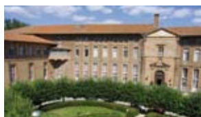
■ Hôtel Dieu St Jacques UFR d'Odontologie de Toulouse