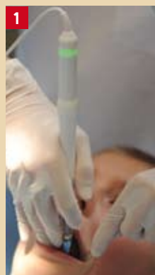
Fig. 1 : Assistance électronique à l'injection de l'anesthésique. Système de type « stylo » (Sleeper One ® , Dental HiTec ™ ) avec utilisation de points d'appuis proches du point d'injection.

Une fois la pénétration de l'aiguille effectuée, l'injection doit être réalisée le plus lentement possible pour éviter la surpression tissulaire génératrice de douleur. Le contrôle de la pression est difficile avec les seringues habituelles, en métal ou plastique, à cause de la pression initiale nécessaire pour « lancer » l'anesthésie 6 et de la difficulté à contrôler au début la force exercée avec la paume de la main lorsque le piston de la seringue est totalement hors du corps de celle-ci. Des systèmes d'assistance électronique à l'injection existent (Sleeper One ® , The Wand ® , Anaject ® , Quick Sleeper ® ) (Fig. 1 et 2) qui permettent de débiter avec un rythme lent (goutte à goutte) et d'accélérer progressivement. Ces systèmes sont efficaces 7 et