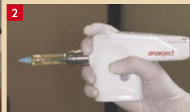
Fig. 2 : Assistance électronique à l'injection de l'anesthésique. Système sans fil électrique ou tuyau d'arrivée de l'anesthésique (Anaject ® , Milestone Scientific ™ )